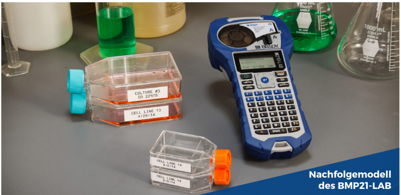
Nachfolgemodell des BMP21-LAB

Profitieren Sie jetzt von vordimensionierten Etiketten und noch mehr Materialien, die sich für die anspruchsvollsten Anforderungen bei der Laborkennzeichnung eignen. Dank der intelligenten und automatischen Formatierungsfunktionen des M210 müssen Sie lediglich eine Etikettenkassette einsetzen, Daten eingeben und schon können Sie drucken.